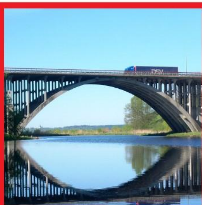
Жокер за намиране на предмета от картата: прозорците на училището или вратите

Много геометрична структура. Структури като сгради, статуи, врати, прозорци, мостове