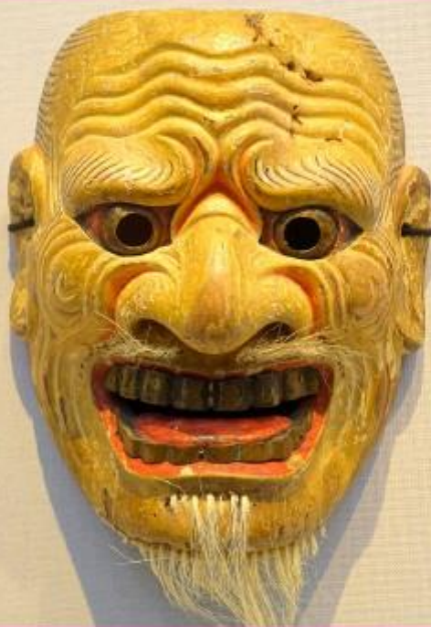
Жокер за намиране на предмета от картата: коридор 3 етаж