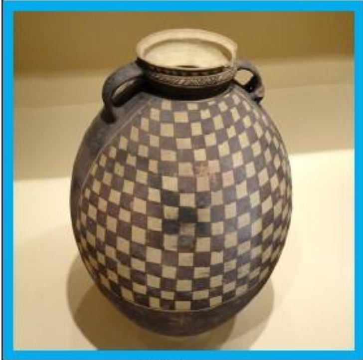
Жокер за намиране на предмета от картата: намирано се на 4. етаж в малкия коридор

Произведение на изкуството, което има интересни геометрични фигури