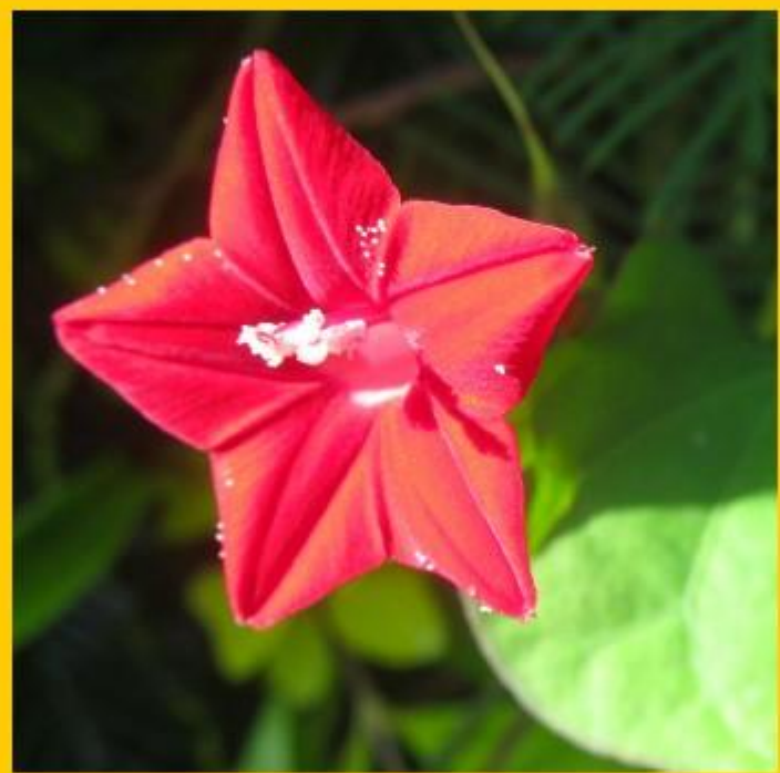
Жокер за намиране на предмета от картата: саксия с цветя

Пример: цвете, растение, плод, зеленчук, скала и т.н.