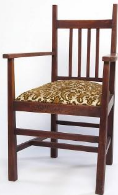
Жокер за намиране на предмета от картата: класна стая

Обект само с плоски повърхности и остри ъгли